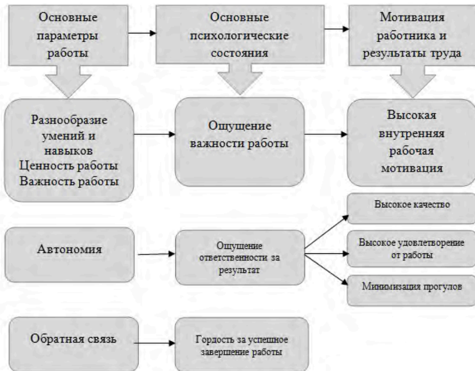
Рис. 6. Модель мотивации Хекмана и Олдхэма

В основе модели мотивации Хекмана и Олдхэма лежит рассмотрение мотивации трудовой деятельности опосредованной различными характеристиками работы. Модель мотивации Хекмана и Олдхэма представлена на рис. 6.