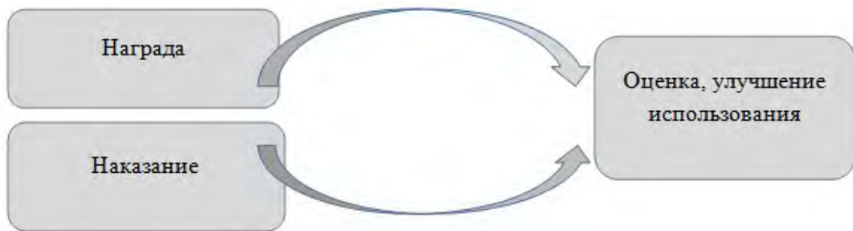
Рис. 1. Рациональная модель мотивации трудовой деятельности

В рамках рациональной модели мотивации персонала используется комбинация поощрений и наказаний. Схематически данная модель представлена на рис. 1.