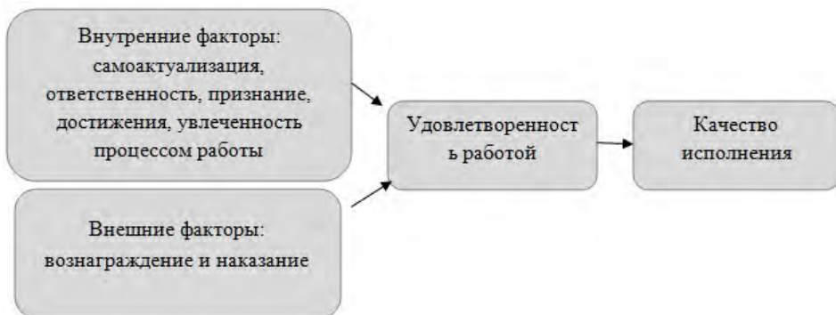
Рис. 3. Модель самоактуализации

занные процессы являются важнейшим условием долгосрочной мотивации. В рамках данной модели подчеркивается влияние на трудовое поведение работника внутренних и внешних мотивационных факторы, причем наиболее важными являются – внутренние 10 . Модель самоактуализации представлена на рис. 3.