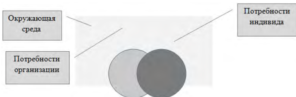
Рис. 5. Взаимозависимость между потребностями организации и индивида и окружающей среды

В данном случае мотивирование работников осуществляется в четком соответствии с потребностями как организации, так сотрудников, в определенной зависимости от влияния как внешних, так и внутренних факторов окружающей среды на организацию и ее членов. Взаимозависимость между потребностями организации и индивида и окружающей среды представлены на рис. 5.