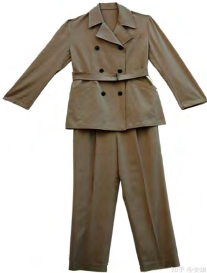
Рисунок 3. «Ленинский пиджак».

до наших дней в зимний период для северных регионов страны. Данный образ оказал огромное влияние и способствовал эволюционному развитию маньчжурского костюмного комплекса. Тема эволюции маньчжурского костюмного комплекса требует дальнейшего углубленного изучения, исследования его воплощения в современной культуре.