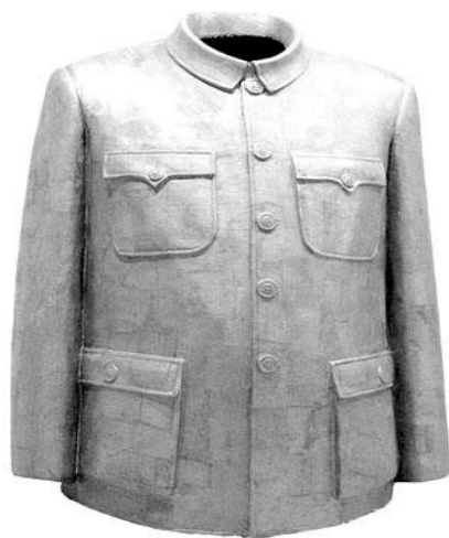
Рисунок 2. Френч «суньятсеновка».

В 50-х годах XX века вслед за подписанием «Соглашения о дружбе между СССР и Китаем» в страну приходят признаки стиля иной зарубежной культуры, которые ассимилируются в местных условиях и обычаях, в том числе с культурой традиционного костюма. Например, такие стилевые признаки как платье, круглый ворот, короткий рукав, диагональная юбка, «ленинка» в русском стиле (это двубортный пиджак). Все это оказало исключительное влияние на прямолинейный силуэт маньчжурского женского костюма. Костюм эпохи Культурной революции - это «ленинский пиджак», который стал популярным после Октябрьской революции в России и такой пиджак носил В.И. Ленин. Это верхняя одежда, для которой характерны европейский воротник, двубортность, саржевая ткань. Также были популярны легкая одежда без подклада и ватники, которые по талии подпоясывались тканевым ремнем,