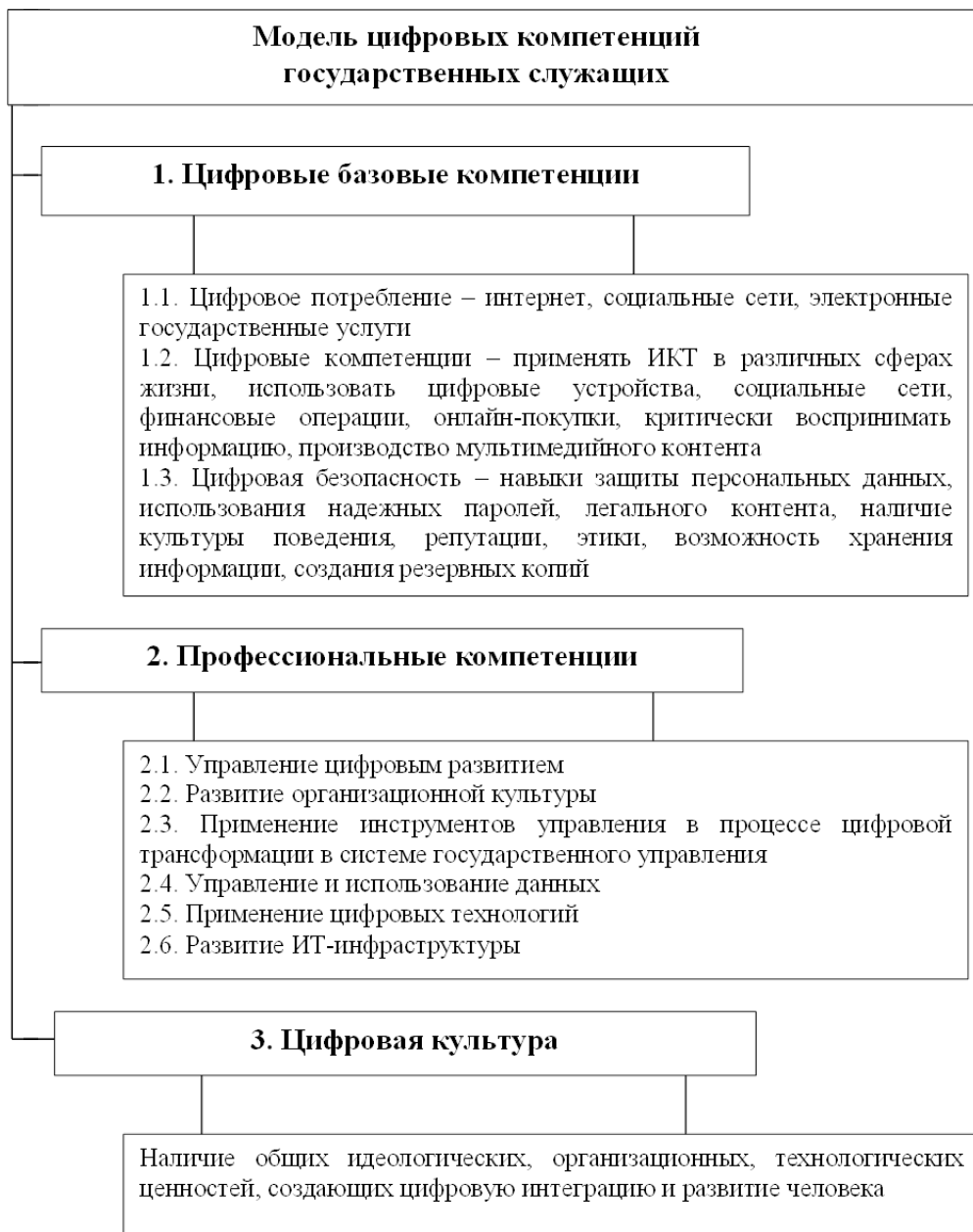
Рисунок 2. Модель цифровых компетенций государственных служащих.