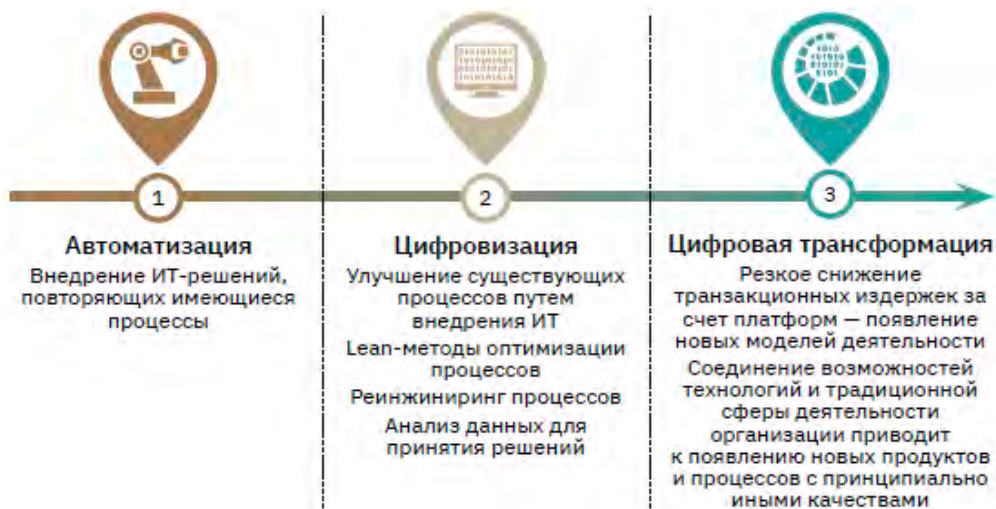
Рисунок 1. Этапы цифровизации процессов в государстве.