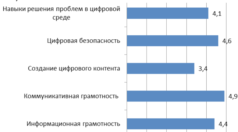
Рисунок 3. Показатели самооценки цифровой грамотности абитуриентов московских вузов 2021 г.