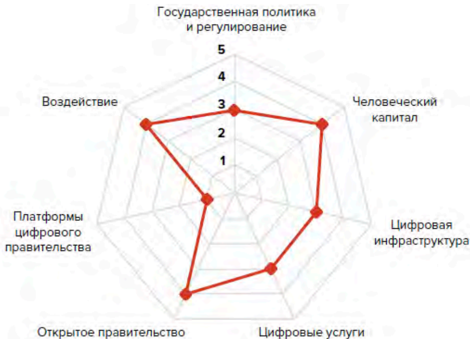
Рисунок 2. Оценка готовности цифрового правительства.