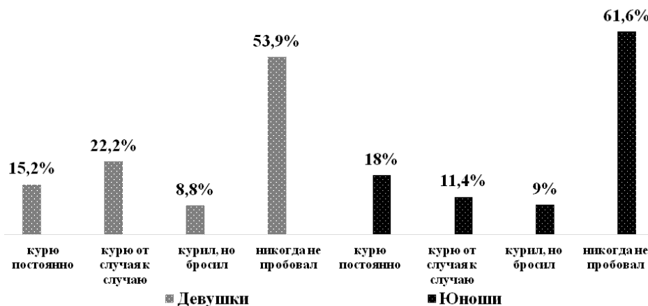
Рис. 1. Распространенность курения среди девушек и юношей, в %.

бого рвеня и 15,9% совсем не интересуются данным направлением.