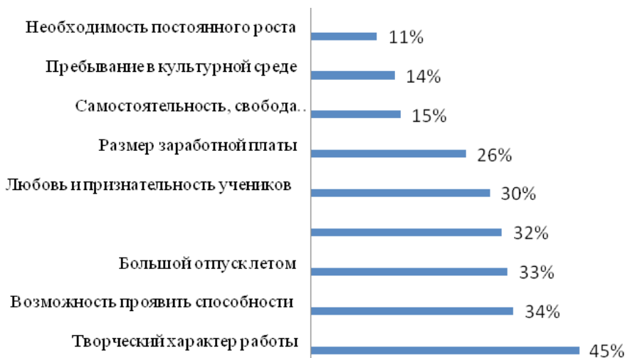
График 1. Привлекательные аспекты учительской профессии, мнение молодых педагогов, % к числу ответивших.

Молодёжь в профессии учителя в большей мере привлекает культурная