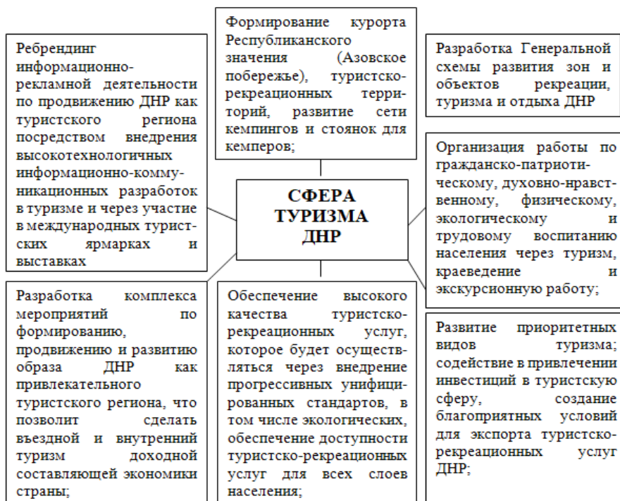
Рисунок 1. Основные направления развития в сфере туризма ДНР.

При создании гостиничных предприятий, нацеленных на людей пожилого возраста, следует учитывать мировой и отечественный опыт туристической индустрии, а также имеющуюся нормативную базу Российской Федерации. Так, общие требования и нормы по организации и оказанию услуг социального туризма указаны, например, в ГОСТ Р 57286-2016 «Услуги социального туризма. Туристские услуги для людей пожилого возраста. Общие требования» и ГОСТ Р 55699-2013 «Доступные средства размещения для туристов с ограниченными физическими возможностями. Общие требования». Кроме того, в силу определенных физических и психологических особенностей данной целевой аудитории при создании специализированных