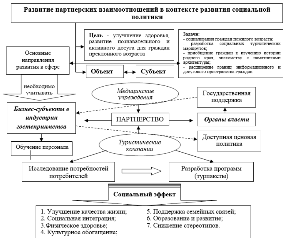
Рисунок 2. Комплексная модель партнерских взаимоотношений в контексте развития социальной политики.

- наличие квалифицированного персонала, имеющего необходимые компетенции, обладающего специальными знаниями и умениями приме-