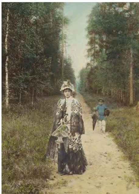
Рисунок 1. Алексей Мазурин. На прогулке. 1898.

Академии художеств, он приобрелся к фотографии и всю жизнь совмещал деятельность художника и фотографа, но всемирное признание получил как фотограф. Карелин снимал портреты, виды Нижнего Новгорода, детей и животных, однако прославили его жанровые сцены, снятые по большей части в интерьере, – «комнатные группы». Его можно считать основоположником русского жанра в фотографии не потому, что он стал первым снимать бытовые сцены, а потому что он вдохнул в них жизнь. В его фотоархиве немало портретов выдающихся деятелей русской культуры конца XIX века: Д. Менделеев, В. Верещагин, М. Горький, В. Короленко, И. Шишкин, К. Маковский, Н. Рубинштейн, А. Боголюбов [1].