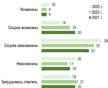
Рисунок 1. Возможность межнационального конфликта.

При проведении мониторинговых исследований чаще всего используют количественные методы сбора первичной социологической информации, например, опрос. Метод субъективный и выбирается в соответствии целей и задач, которых перед собой ставит социолог в данном конкретном случае. В этом