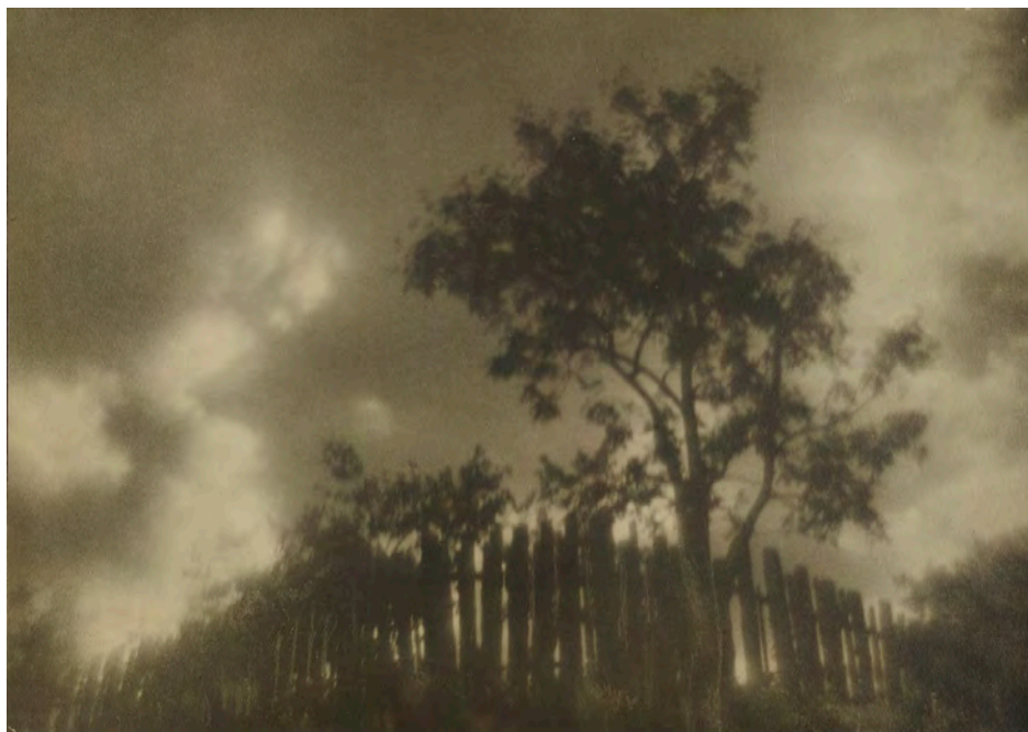
Рисунок 5. Николай Андреев. За околицей. 1920.

Наиболее обстоятельно история русского пикториализма рассмотрена в труде Артема Логинова «Искусство реальности. Фотография XIX-XX веков» [5]. Автор подробно разбирает фотографические выставки первого десятилетия