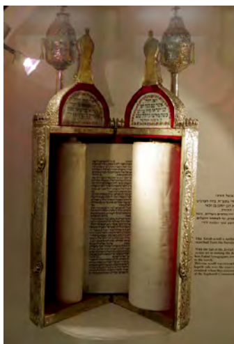
Свиток Торы в открытом футляре. Ашкеназская синагога, Стамбул.