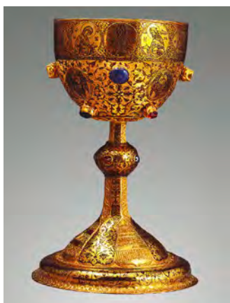
Потир. 1598 г. Золото, чеканка, чернь, драгоценные камни. Музеи Московского Кремля, Москва.