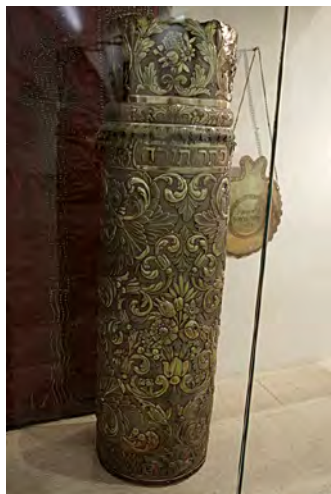
Футляр для свитка Торы. Сефардская синагога, Иерусалим.