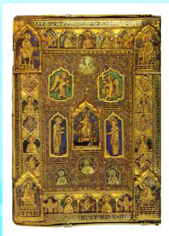
Оклад Евангелия. 1392 г. Серебро, позолота, скань, эмаль. Российская государственная библиотека, Москва.